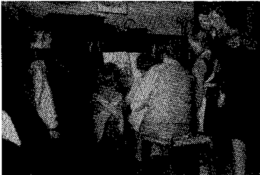
Abendsingen in Weimar