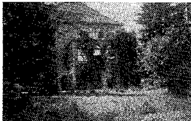
Kindertaus Weimar, Gartenseite