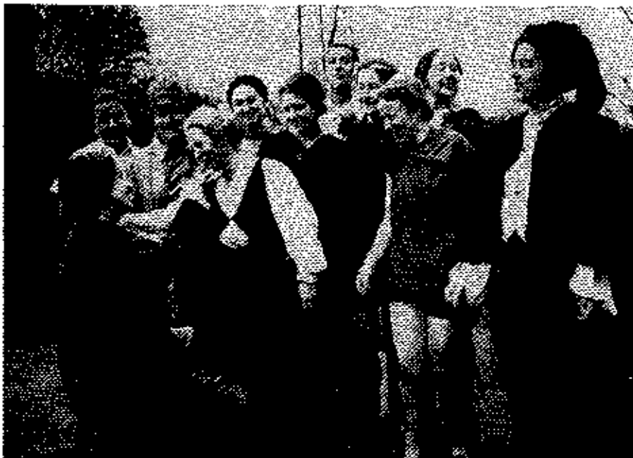
Shakespeare-Aufführung in Hustedt, 30er Jahre