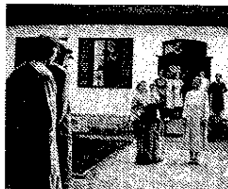
Vor dem Schulgebäude