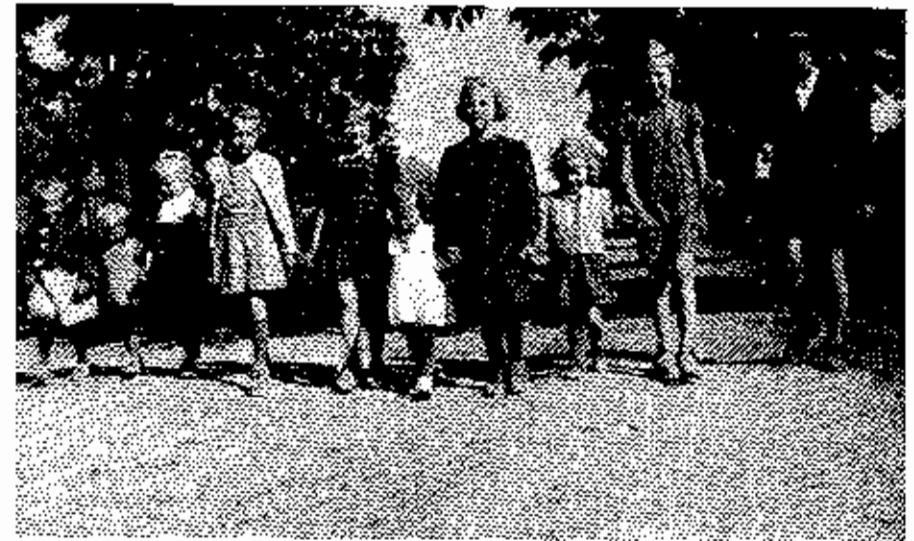
Anmarsch zum Kindergarten