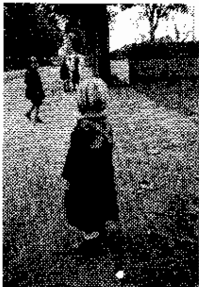
Bei der Auflösung nach Hause gehend

Wenn man ein lebendiges Bild der Schule Schlaffhorst-Andersen aus der Seefelder Zeit geben möchte, so gehören die geschilderten Ereignisse dazu, sie sind eng mit dem Schulgeschehen verwoben. Nur so können sich Menschen, die an dem damaligen Leben nicht teilgenommen haben, eine ahnende Vorstellung von dem vielseitigen inhaltreichen Leben erwerben. Auch wird aus den kurzen Schilderungen erkennbar, daß wir als junge Menschen, wenn wir offen waren, für die vielfältigsten Lebensbereiche etwas lernen und uns erarbeiten konnten. Dies war umso lehrreicher, da wir - wenigstens einige von uns - sehr bemüht waren, das rhythmische Prinzip mit in diese Lebensbereiche hinein zu verwirklichen.