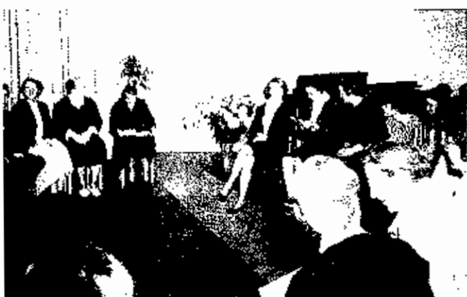
Kursus 1963 im Vortragsraum