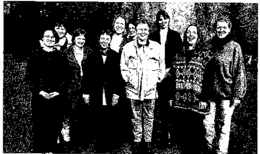
Kurs „Basisfunktionen“ 1997

Das Foto zeigt die zehn Teilnehmerinnen im Park der Heimvolkshochschule. Dem Wunsch nach Fortsetzung wird im Programm des nächsten Jahres Rechnung getragen, vom 21. bis 24. Mai 1998 kann es weitergehen!