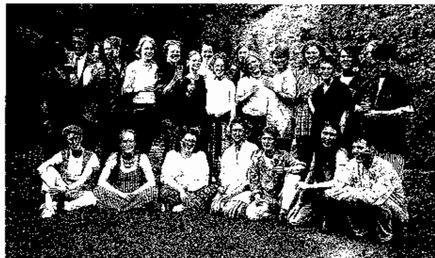
Examen bestanden! Juni 1997