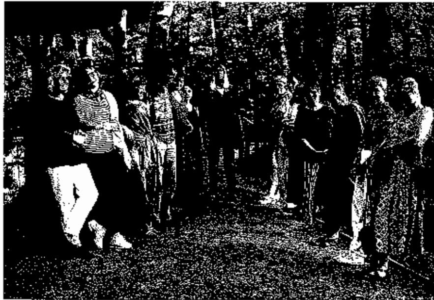
Kurs „Die Atemschriftzeichen“ 1997

Das zweite Foto zeigt die Teilnehmerinnen und den Teilnehmer des Kurses über die „Atemschriftzeichen“ bei abendlichem gemeinsamen Spaziergang hoch über der Ilmenau, wo spontan ein schönes gemeinsames Singen entstand.