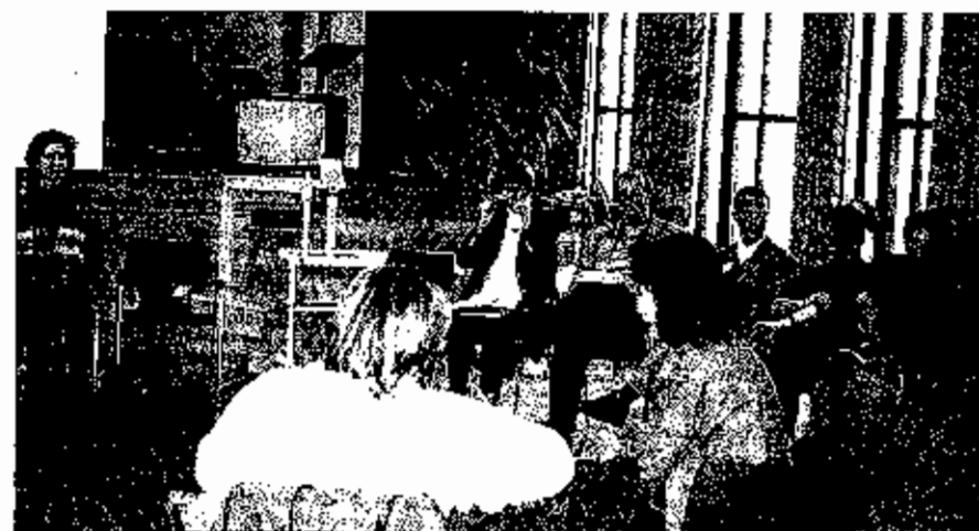
1. Nenndorfer Therapietag

Nachhilfeunterricht helfen kann, sondern daß hier die Hilfe einer ausgebildeten Therapeutin notwendig ist. So können z. B. über die Verknüpfung von Sprechen und Schreiben, über die Einbeziehung atemrhythmischer ganzkörperlicher Bewegungen erstaunliche Erfolge erzielt werden. In der anschließenden Diskussion erörterten die Teilnehmer/innen u. a., wie weit das „Handwerkszeug“ einer Atem-, Sprech- und Stimmlehrerin bei der Therapie von Legasthenie und Lernstörungen sinnvoll einzusetzen sei und ab wann ein speziell ausgebildeter Lerntherapeut einbezogen werden müsse.