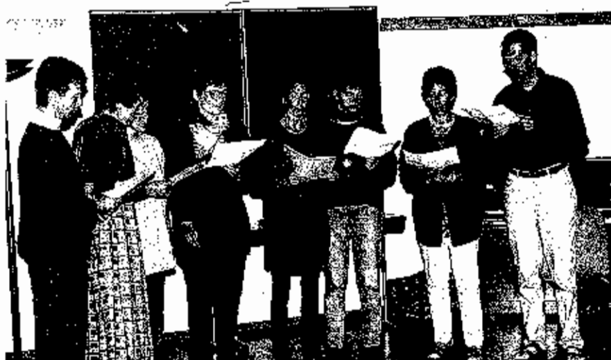
Vortragsabend in Bad Bevensen-Madingen