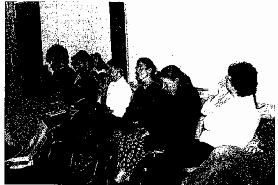
Vortragsabend in Bad Bevensen-Medingen