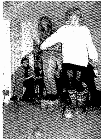
Gleichgewicht halten auf der wandernden Schildkröte.