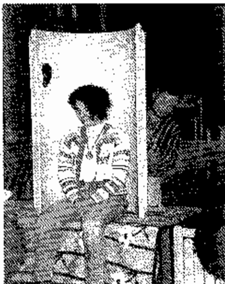
Töne mit allen Sinnen wahrnehmen in der Klangwiege