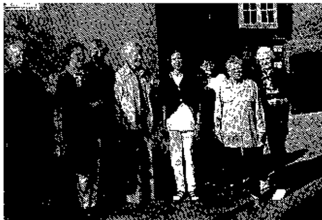
Mitgliederkurs vom 25.–27. 9. 98 „Schläft ein Lied in allen Dingen . . .“