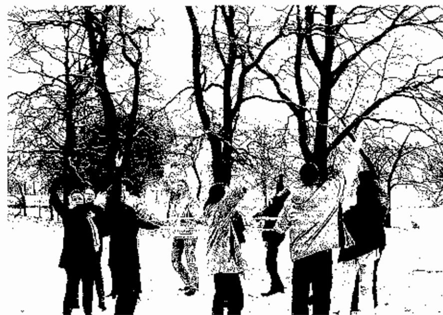
Schüler-Kurs im Januar 2000