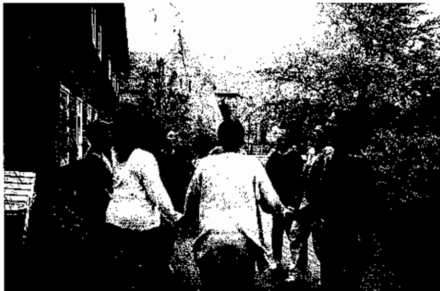
Pfarrhof Bergkirchen, „Basisfunktionen“ 8.–12. 5. 02