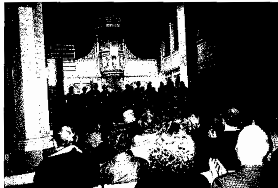
Geistliche Abendmusik in der St. Godehardi-Kirche.

25 Jahre im CJD: CJD Schule Schlaffhorst-Andersen Bad Nenndorf Drei Festtage mit vier großen Veranstaltungen, vorbereitet von allen SchülerInnen und KollegInnen! Was möchten Sie wissen?