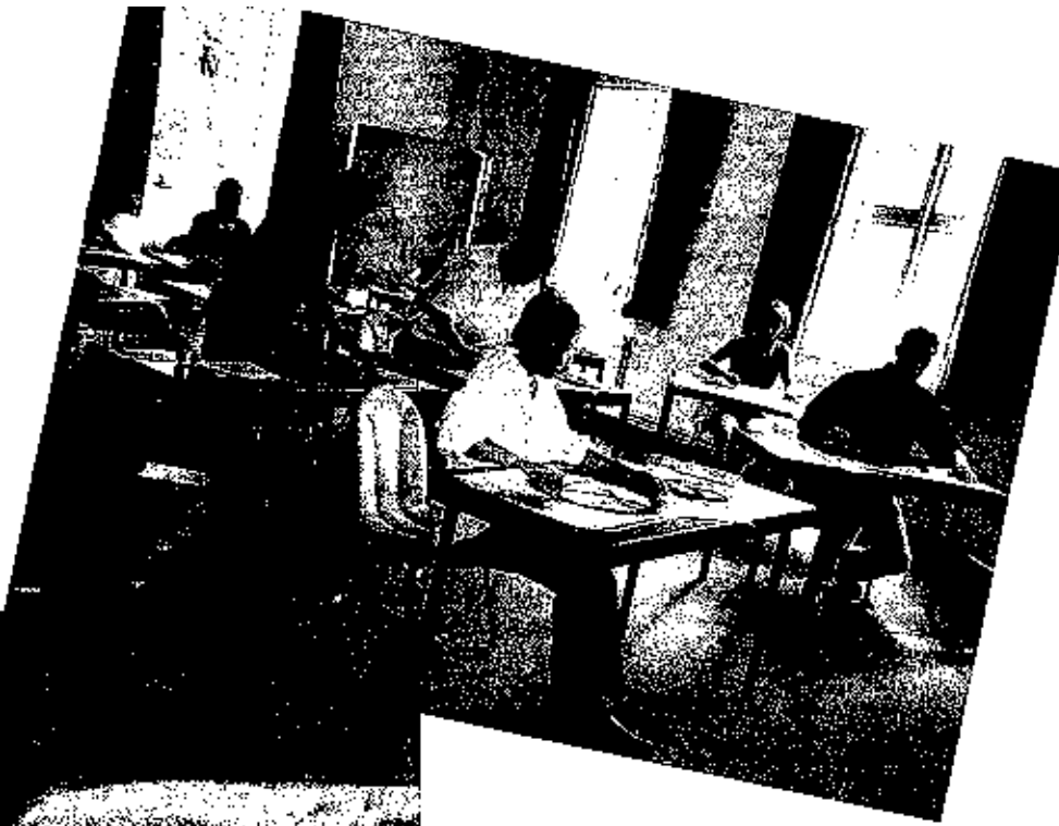
„Atemschriftzeichen“-Kurs in Bad Bevensen.