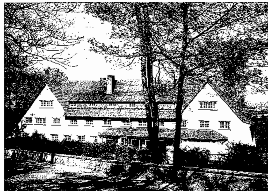
Tagungsstätte Wissenhaus in Loheland bei Fulda

ausmacht. Ein Foto des „Wissenhauses“, wie die Tagungsstätte heißt, geben wir Ihnen hier wieder.