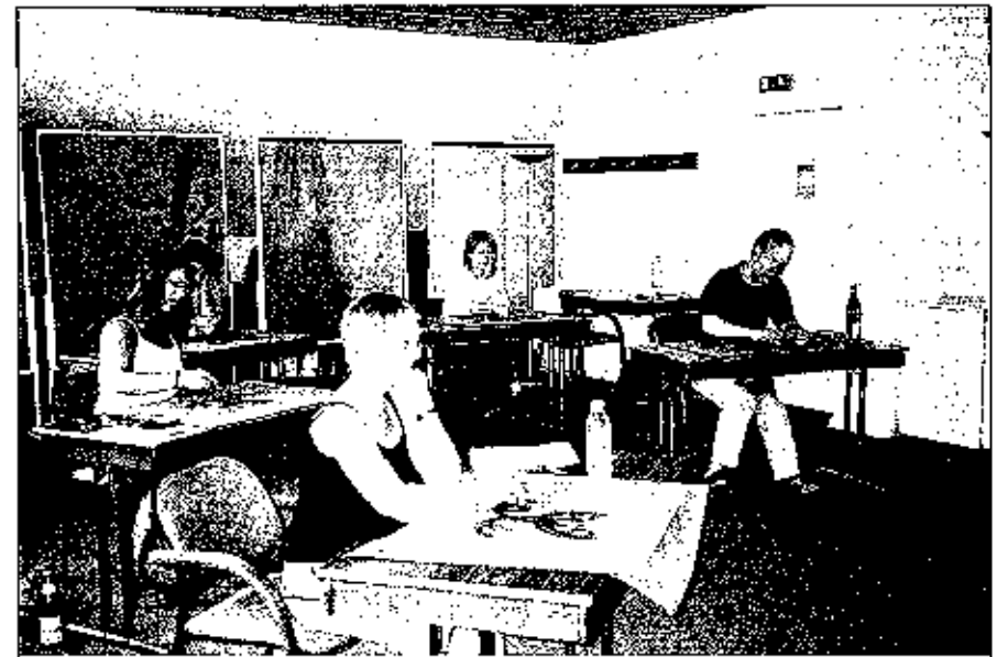
Zeichen 11, das „Atemmännchen“ bietet Gelegenheit zum Schaffen eigener Texte und Melodien