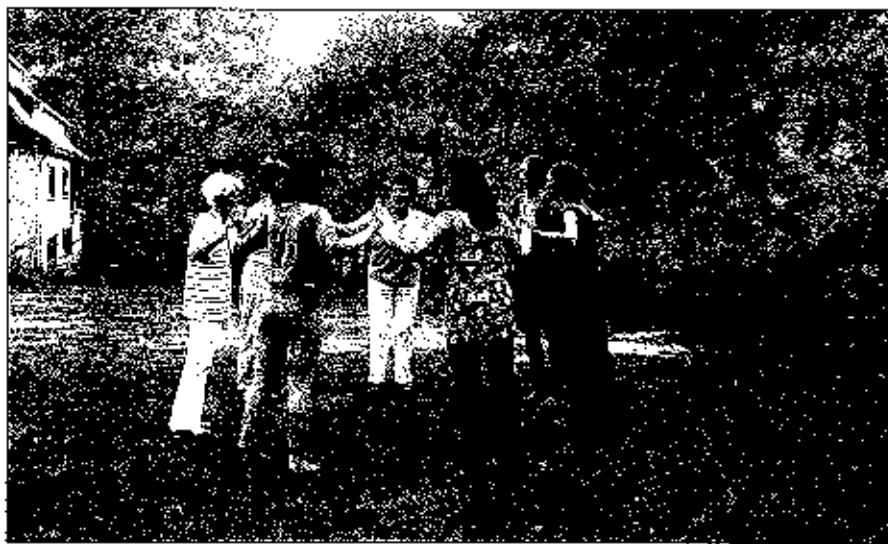
Schwingen am Morgen