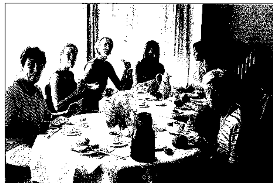
Endlich was zu essen! ...