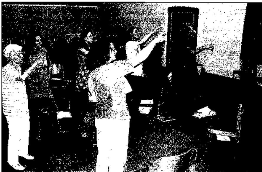
„Verkörpern“ der Lage der Töne