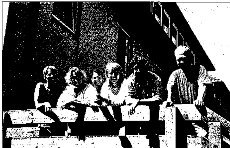
Vor dem Arbeitsraum in Bad Bevensen