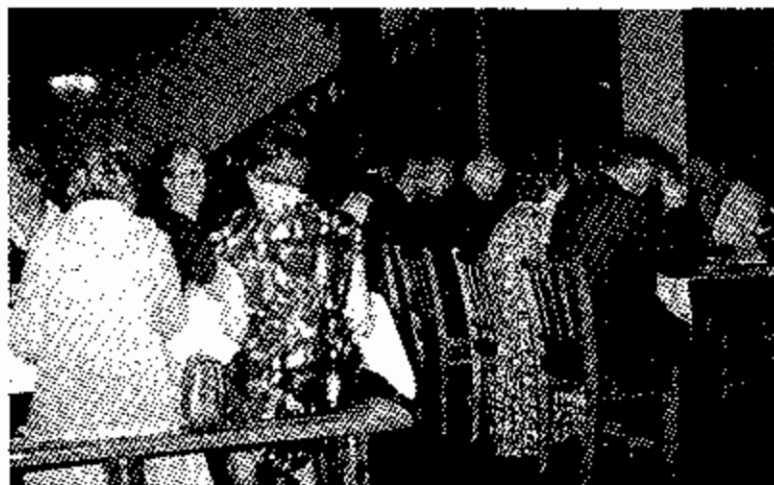
Festessen in der Diele