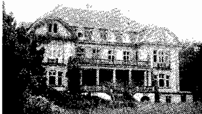
Pfingsten 1961 Einweihung von Schloß Eldingen als Schule Schlaf- horst-Andersen